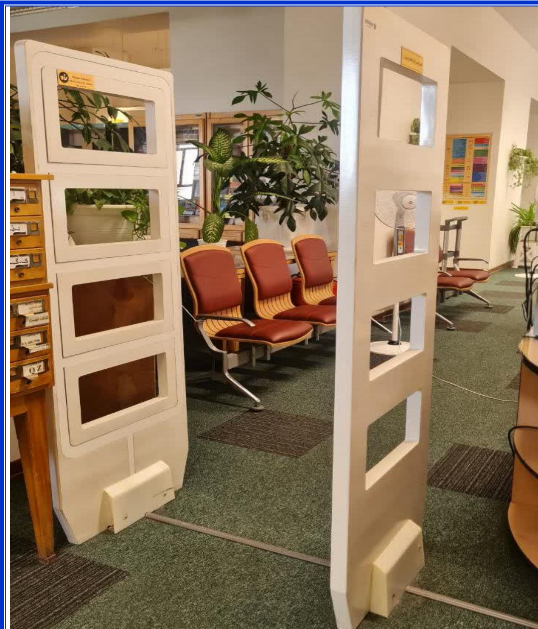
تجهيزات كيت امانت كتب